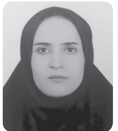
هفته نامه استانی ثلاث جنوب در ادامه معرفی ظرفیت های انسانی منطقه، در این شماره به معرفی یکی